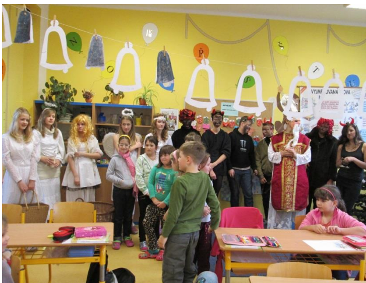
Mikuláš ve škole