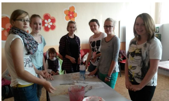
Pečení mikulášských perníčků

Devátáci a seniorky z naší obce si užili listopadové páteční odpoledne ve škole, kdy společnými silami napekli pro všechny žáky školy linecká srdíčka. Naši školu určitě navštívil Mikuláš, tak s přispěním Klubu rodičů Bublina rozdá dětem jak napečené linecké, tak další dobrůtky a sladkosti.