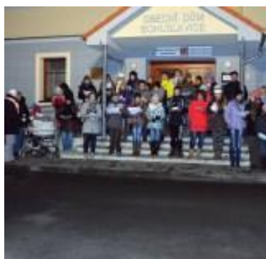
Česko zpívá koledy